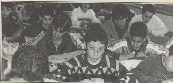
Les 4e du collège Albert Camus, à Besançon. Concentration.

L'orthographe, grâce aux Dicos d'or, serait-elle en train de perdre sa réputation de matière rébarbative ? Topo a pu le noter au collège Camus (Besançon) où, comme dans la plupart des établissements, le taux de participation était important : 6 classes