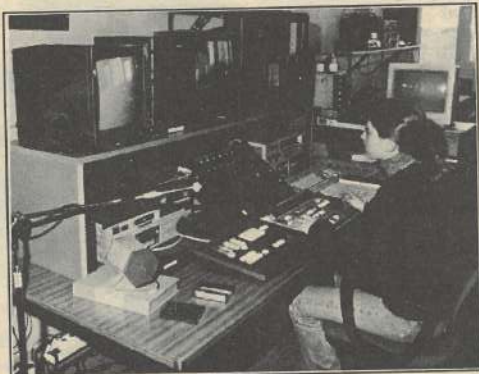
L'équipement audiovisuel de l'IUT sera au Salon régional de la Jeunesse.

Activité d'animation, mais qui permettra également au public d'observer l'utilisation du matériel audiovisuel, puisque le montage sera lui aussi réalisé sur place, devant le public. L'ensemble du matériel, caméras Hi8 pro, Betacam, table de