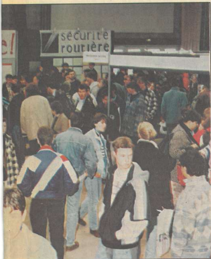
L'an dernier, environ 30000 personnes étaient venues au premier Salon régional de la jeunesse.