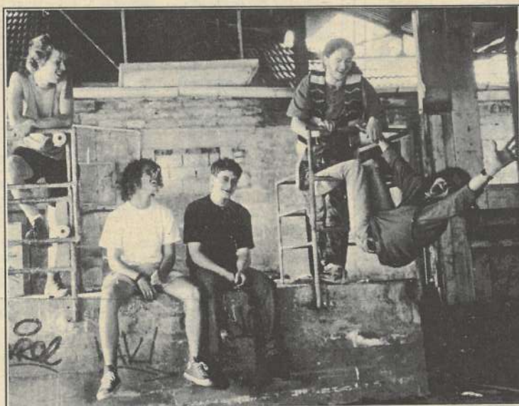
Sticky Finger, en route pour les Eurockéennes ?

Le 23 mars à partir de 17 heures huit groupes régionaux seront en concert au Parc des Expositions de Besançon. Sur une vraie scène, pour la soirée de clôture.