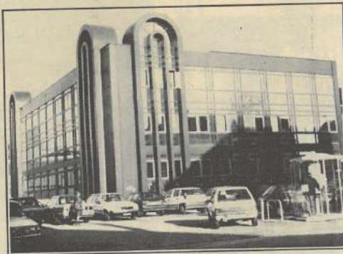
L'école accueille chaque année 30 à 40 étudiants recrutés sur dossier et concours.