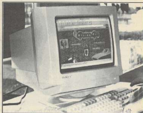
Tout savoir sur les récentes évolutions informatiques.

au sein d'un forum thématique rassemblant les acteurs des nouvelles technologies en Franche-Comté.