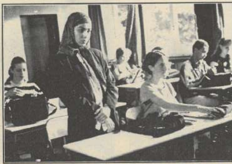
SA VIE A ELLE DE Romain Goupil.

Comme l'an dernier, plusieurs courts métrages de la série «3000 scénarios contre un virus» seront projetés, avec d'autres films de jeunes réalisateurs, en présence d'auteurs, d'acteurs, et techniciens des films régionaux. Cette programmation est mise en place par la Région de Franche-Comté. Projections le jeudi 21 mars et le samedi 23 à 12h, 13h, 14h et 15h.