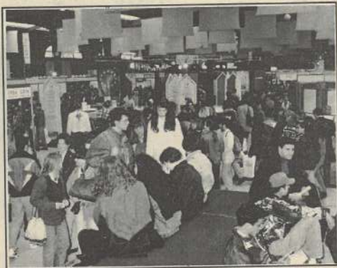
L'an dernier, la Région avait déjà insisté sur les programmes d'échanges.

La Franche-Comté soutient depuis longtemps les programmes d'échanges internationaux de jeunes. Considérant que ces derniers constituent un plus dans la formation, la Région espère faire en sorte qu'en 2005, 10 % des jeunes aient passé une période significative de leur formation à l'étranger. Pour la région, cela représente environ 900 étudiants ou stagiaires. A l'heure actuelle, ils sont environ 700 à partir chaque année. Pour développer les programmes européens (socrates, Leonardo, Tempus, Jeunesse pour l'Europe III...), la Région a par exemple mis en place la mission «Euronove». A travers Comett par exemple, programme de l'Union européenne qui s'est terminé l'an dernier, 900 franc-comtois ont pu effectuer un stage à l'étranger entre 1987 et 1995. Mais le Conseil régional ne se contente de soutenir les projets existant, émanant de l'Union européenne ou d'ailleurs. Elle a également contribué à