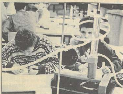
Des formations supérieures variées.

Enfin, l'École de gestion et de commerce avec sa section FOR-COMEX-EST spécialisée dans les relations commerciales avec les pays de l'Est intéresse aussi