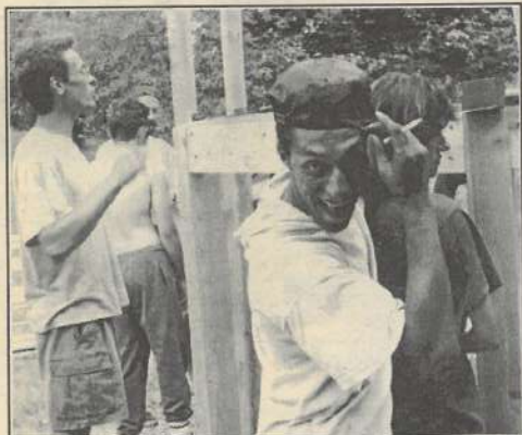
«Il y a un moyen de vivre autrement en société». Ici, un chantier de jeunes organisé par Solidarités jeunesse.

Leur point commun ? «L'éducation populaire peut se résumer à trois choses : le développement de l'esprit critique, l'apprentissage mutuel et l'éducation à la citoyenneté». Trois aspects qui sous-tendent le regroupement d'associations très différentes et qui déclinent le projet chacune à leur façon. Réactivé en 1994, le CRAJEP de Franche-Comté est à l'image du CNAJEP, son pendant au niveau national : «Il y a des organismes issus historiquement d'obédiences très