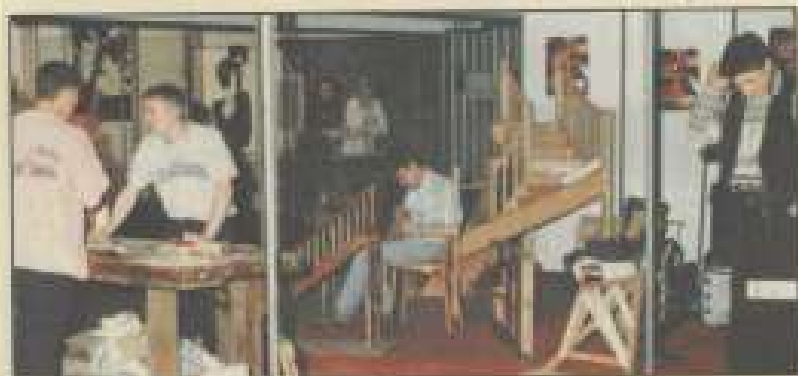
Les artisans du Village des métiers : travail en direct.