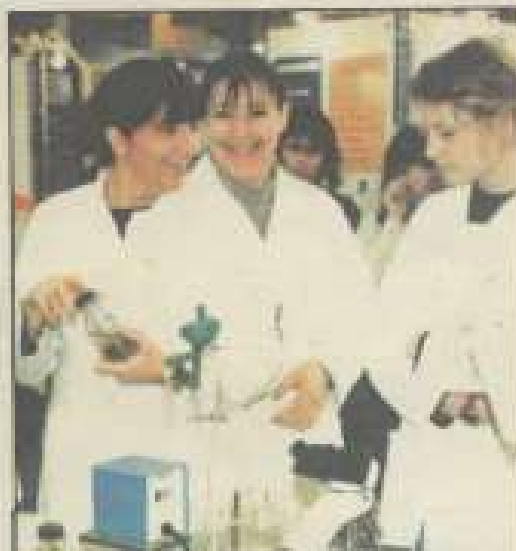
BTS biotechnologie... une des formations d'enseignement supérieur de Haute-Saône.