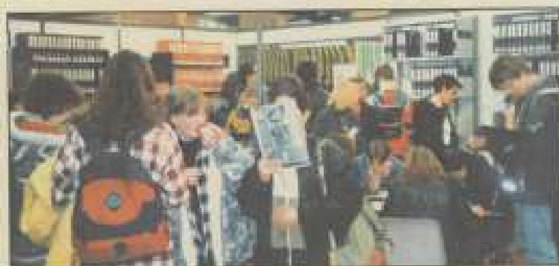
Stand du réseau Information Jeunesse