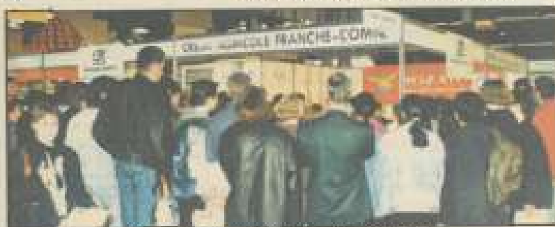
Du monde autour du Crédit agricole.