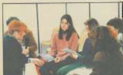
Discussion autour du métier de conservateur.