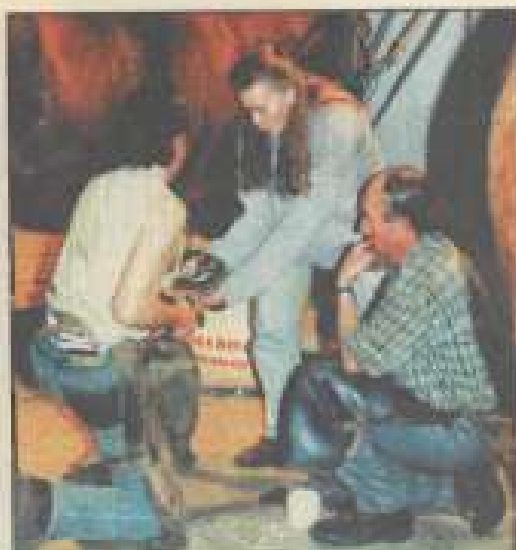
Ferrage de sabot par l'école d'agriculture St-Joseph de Levier.