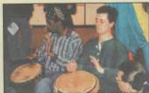
Education populaire : le sens de l'animation.