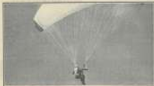
Un sport qui peut se pratiquer à partir de 14 ans.

«On se dirige par le parapente du décollage : le vol libre