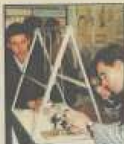
Sur le stand de l'Université.